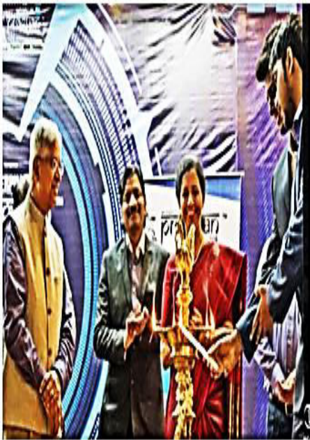
NIT-T Director lights the lamp at the Inaugural. —DC

It is also remarkable that there will be a 'Human Library' for the first time ever in 'Pragyan', the