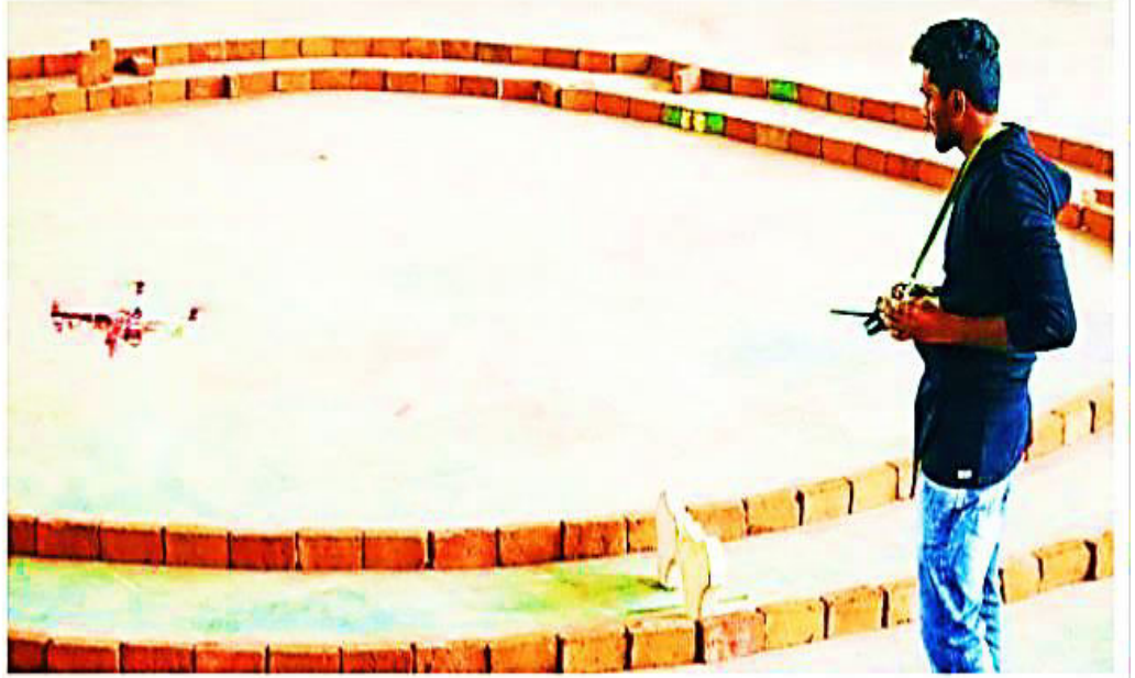
திருச்சி தேசிய தொழில்நுட்பக் கழகத்தின் பொறியியல் மாணவர்களுக்கு சனிக்கிழமை நடைபெற்ற ரோபோடிக் போட்டியில் ஆள் இல்லா விமானத்தை இயக்கும் மாணவர்.

திருச்சி தேசிய தொழில்நுட்பக் கழகத்தில் (என்ஐடி) பிரக்யான் மாநாடு வியாழக்கிழமை தொடங்கியது. இதன் ஒருபகுதியாக மாணவர், மாணவிகளுக்கு சனிக்கிழமை பல்வேறு போட்டிகள் நடைபெற்றன. பொறியியல் பிரிவில் தானியங்கி படகுப் போட்டி நடைபெற்றது. நீச்சல் குளத்தில் நடைபெற்ற இந்தப் போட்டியில் பல்வேறு கல்வி நிறுவனங்களைச் சேர்ந்த 20 அணிகள் தங்களது தானியங்கி படகுகளை இயக்கினர். இதே போல, ரோபோ விஜியான் எனும் ரஷ் ஹவர் போட்டியில் பொறியியல் மாணவர்கள் உருவாக்கிய ரோபோடிக் வகைகளை இயக்கி காட்டினர். இதில், 45 அணிகள் கலந்து கொண்டன. விண்ணிலிருந்து இலக்கை தாக்கும் வகையிலான ஆனில்லா விமானம், மனிதர்களின் வேலைகளை செய்யும் ரோபோடிக் என பல்வேறு அம்சங்கள் பார்வையாளர்கள் பிரமிப்பில் ஆழ்த்தின.