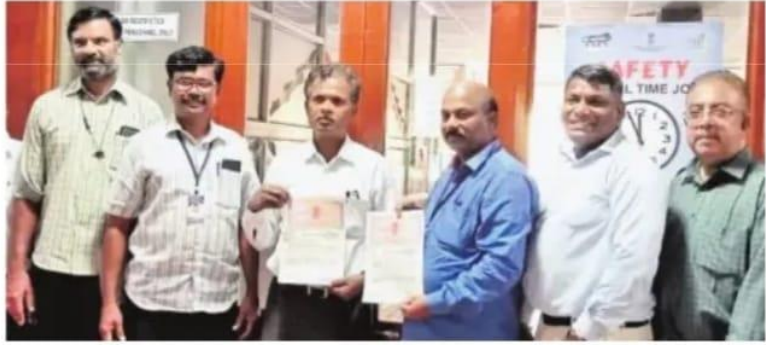
தொழில்முனைவோருக்கு உதவிடும் வகையில் புரிந்துணர்வு ஒப்பந்தம் செய்து பரிமாற்றிக் கொண்ட டிடிட்சியா நிர்வாகிகள் மற்றும் திருச்சி என்ஐடி பேராசிரியர்கள்.

இந்த இரண்டு நிறுவனங்களும் இணைந்து தமிழகத்தில் புதிய தொழில் நுட்ப நிறுவனங்களைத் தொடங்குவதற்கு வழிகாட்டவும், தமிழகத்தில் உள்ள சிறு, குறு, நடுத்தர தொழில்நிறுவனங்களை வளர்ச்சிப்பாதையில் கொண்டு செல்லவும் ஆக்கப்பூர்வ பணிகளை மேற்கொள்ளவுள்ளன. இதன் ஒரு பகுதியாக, விழிப்புணர்வு முகாம்கள், தொழில்நுட்ப பயிற்சிகள், தொழில்நுட்ப உதவிகள், தொழில்நுட்ப