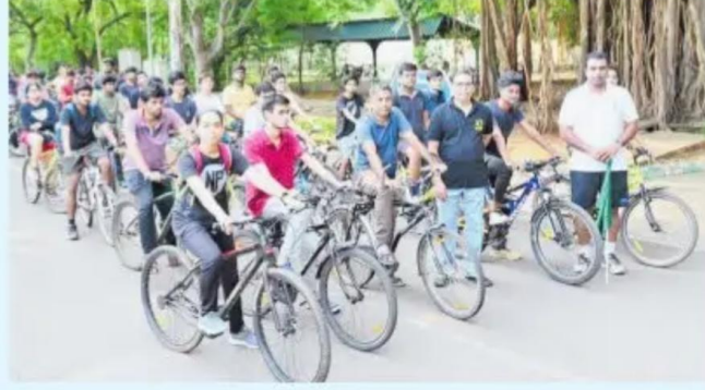
திருச்சி என்ஐடி வளாகத்தில் ஞாயிற்றுக்கிழமை நடைபெற்ற சைக்கிள் பேரணி.

திருச்சி, ஜூன் 4: உலக சைக்கிள் தினத்தையொட்டி திருச்சி தேசிய தொழில்நுட்பக் கழகத்தில் (என்ஐடி) சைக்கிள் தின விழிப்புணர்வுப் பேரணி ஞாயிற்றுக்கிழமை நடைபெற்றது.